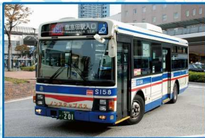
川崎鶴見臨港バス